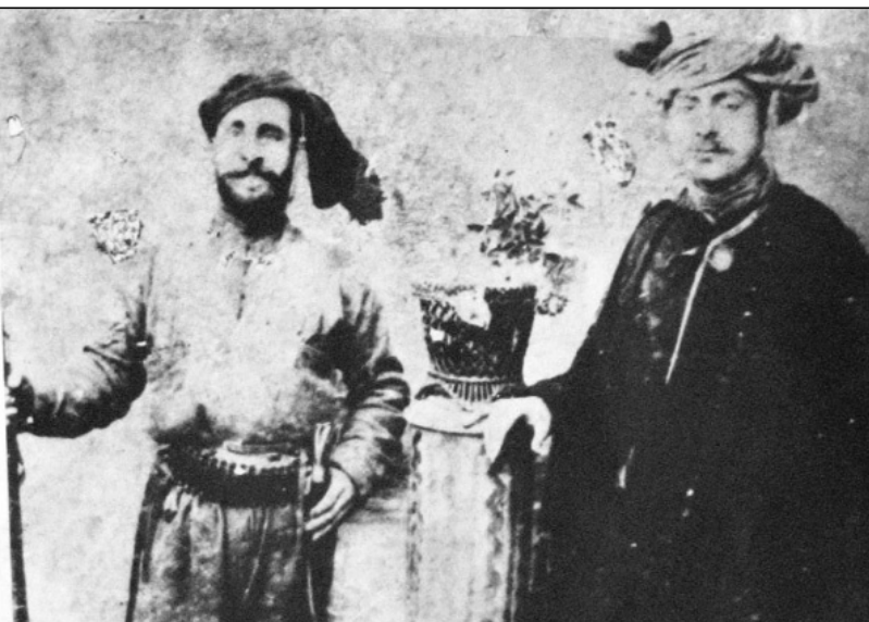
შეცვალა. ციმიბრამდე არ ჩაულწვია, გზაში წვიდრო ხელ-ფეხზე ბორკილები. სამშვიდობოს გავიდა. მერმინდელი მისი გზა-კვალი უცნობია“.