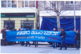
მხარდაჭერა მეხანძრე მაშველებს