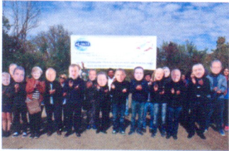
საპროტესტო აქცია ღვანში