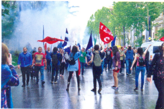
გახდი სოლიდარული ახალგაზრდა, იბრძოლე სამართლიანობისთვის !

2013 წლის მარტში, პროფესიული კავშირების ახალგაზრდულ ორგანიზაციაში შეიქმნა შეიდი გაერთიანება: სტუდენტების, სკოლის მოსწავლეების, ახალგაზრდული არასამთავრობოების, პროფესიული კავშირების გაერთიანებაში შემავალი დარგების, შოუ-ბიზნესის წარმომადგენლების, მასმედიის წარმომადგენლების, სპორტის და სხვა ახალგაზრდების გაერთიანება. ჩატარდა ფორუმი პროფკავშირების კულტურის ცენტრში და გაიმართა ახალგაზრდული ორგანიზაციის პრეზენტაცია. ფრიდრიხ ებერტის ფონდის მხარდაჭერით მოეწყო სამდღიანი სემინარი კენსობში, ორმოცდაათი ახალგაზრდისთვის, რომელსაც უძღვებოდნენ ჩეხეთისა და გერმანიის პროფკავშირების ახალგაზრდული ორგანიზაციების წარმომადგენლები.