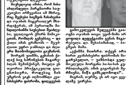
არაპრო არ სურს, მოსკოვი მხრად გადავიდეს