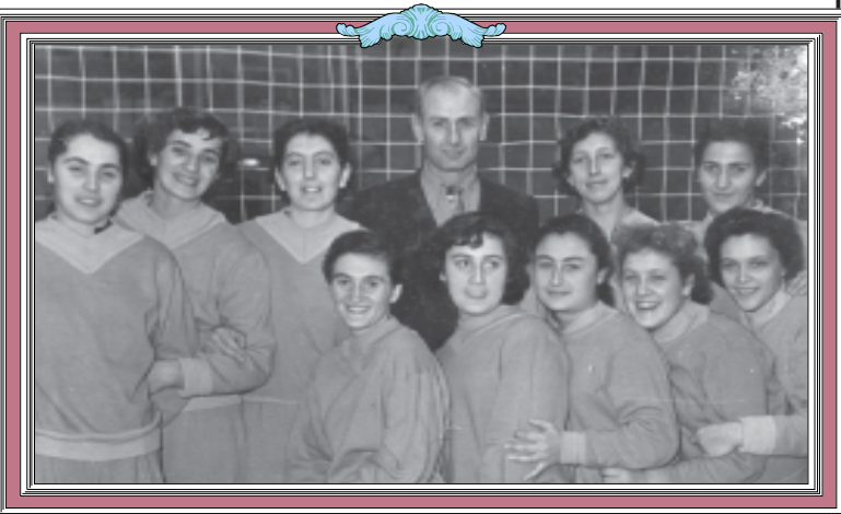
საბჭოთა პარტიის ფრენდლული ქალბატონი ეკელას რაიდე... 1956 წელს.