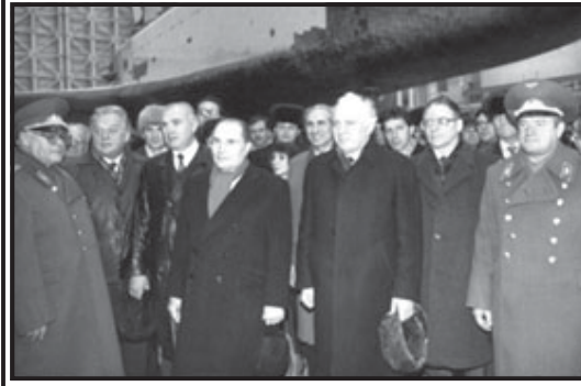
საწყობი ლორი მდინის მინიდან... (Caption for the image above.)

ნაწყობი ლორი მდინის მინიდან... (Text mentions a specific diplomatic event or period.)