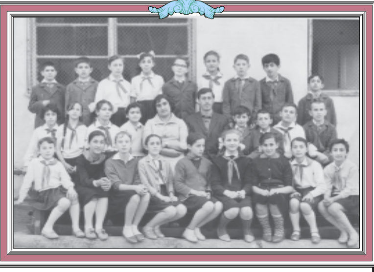
თბილისის 126-ე საშუალო სკოლის V კლასის მოსწავლეები პედაგოგებთან ერთად. 1966 წელი.