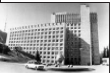
06:00:00 მხარე არის საქართველოსთან აქტიური თანამშრომლობისათვის. ეს არის ნათქვამი ინტერვიუს პრეზიდენტის აბდულ კალამის წინაშე, რომელიც მან საქართველოს პრეზიდენტს ედუარდ შევარდნაძეს ინტერვიუს პრეზიდენტის აბდულ კალამის წინაშე.

თუბელ ჩვენს საერთო განცხადებაში მიმდინარე წლის მისი პრეზიდენტის პეკინში და მე სავაჭრო განცხადებით, რომ მემორანდომი ვითარდება საქართველოსთან ანტიკორუფციულ სექტორში.