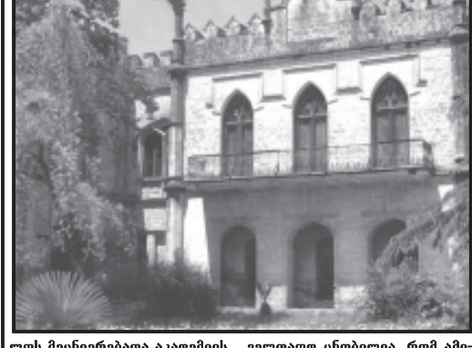
დადიანების ამბები... 50 დოლარად