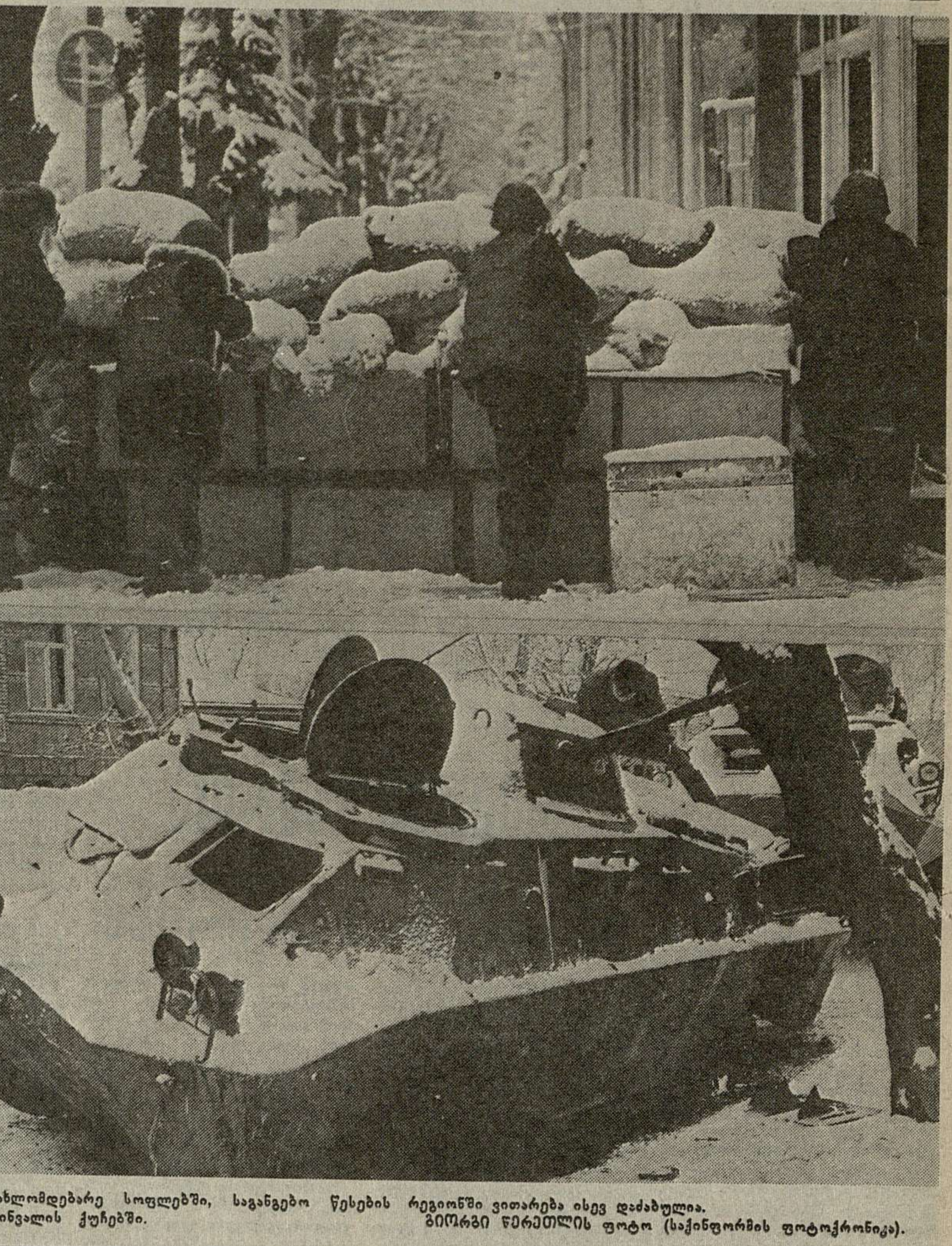
ცნობისათვის, ახლომდებარე სოფლებში, საგანგებო წესების...