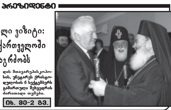
იხ. 80-2 გვ.

პრეზიდენტი ათენისა და სრულიად ელადის მთავარეპისკოპოსის ისტორიული ვიზიტი: ანდრია პირველწოდებული საქართველოში ქრისტიანობის ქადაგებას განაგრძობს მართლმადიდებლობის როლი ქართული სახელმწიფოებრიობის ისტორიაში, ქართული და პერსიან ხალხების მრავალსაუკუნოვანი სულიერი მეგობრობა და ორ ერთმანეთს ეკლესიის შორის თანამშრომლობა - ასეთი იყო საქართველოს პრეზიდენტის ანდრია პირველწოდებულის ვიზიტის მიზანი. ანდრია პირველწოდებული საქართველოში ქრისტიანობის ქადაგებას განაგრძობს მართლმადიდებლობის როლი ქართული სახელმწიფოებრიობის ისტორიაში, ქართული და პერსიან ხალხების მრავალსაუკუნოვანი სულიერი მეგობრობა და ორ ერთმანეთს ეკლესიის შორის თანამშრომლობა - ასეთი იყო საქართველოს პრეზიდენტის ანდრია პირველწოდებულის ვიზიტის მიზანი. ანდრია პირველწოდებული საქართველოში ქრისტიანობის ქადაგებას განაგრძობს