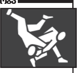
კე, რომელმაც 2 შერქინება მოიგო...