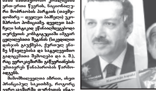
მნიშვნელოვანი გარკვეული ნაწილის აზრით, ბაქალის ეს წინადადება სწორედ ამას ისახავდა მინდა.

11 ივლისს, ისმაილ ჯემი საგარეო საქმეთა მინისტრის თანამდებობაზე დატოვდა. არაუგადად განხორციელდა პარტიის რეგულაციები მათ შორის. ეს შედეგად რატიონალური ერედის მიმართული მოქმედებები კვლავ იმამე დერვიშმა, რომელიც საბოლოოდ ცხადყო, რომ არსებული ხელისუფლება ფუნქციონირების გაგრძელებას ვერ შეძლებდა, ხოლო ვადაზღვიო არჩევნების ჩატარება ვარაუდობდა იმის შესახებ.