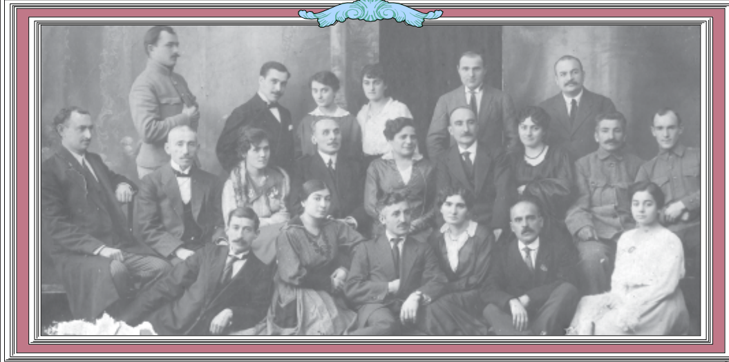
თამარის სენისმოყვარეობა დას. მე-3 რეჟიმის მარტინიან პირველი სევერიან პუბლიკა. 1923-24 წწ.