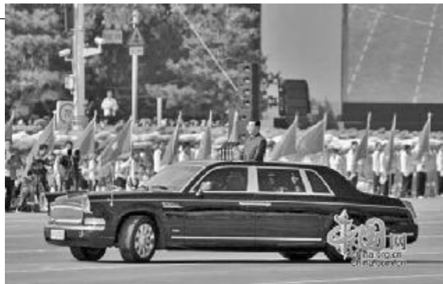
ეების „კრასნოე ზნამიას“ მარკის დაჯავშნილ ლიმუზინს. მისი სიგრძეა 6,4 მეტრი, წონა — დაახლოებით 4,5 ტონა. ხმების თანახმად, ლიმუზინი ტოიოტას ბაზაზე ხელი-თაა აწყობილი.

მაგრამ რამდენიმე წლის წინათ სურვილი გაჩნდა იმისა შესახებ, რომ მთავარი ავტომობილი მაინც უნდა იყო-სო. 2014 წლის შემოდგომაზე სამრეწველო ვაჭრობის სა-მინისტრომ გამოაცხადა კონკურსი პროექტ „კორტეჟის“ რეალიზაციაზე. ავტომობილების სახის, მათ შორის დაჯავშნილებისა სახელმწიფოს პირველი პირებისთვის, დამუშავება შეფასებული იქნა 8 მილიარდ რუბლად.