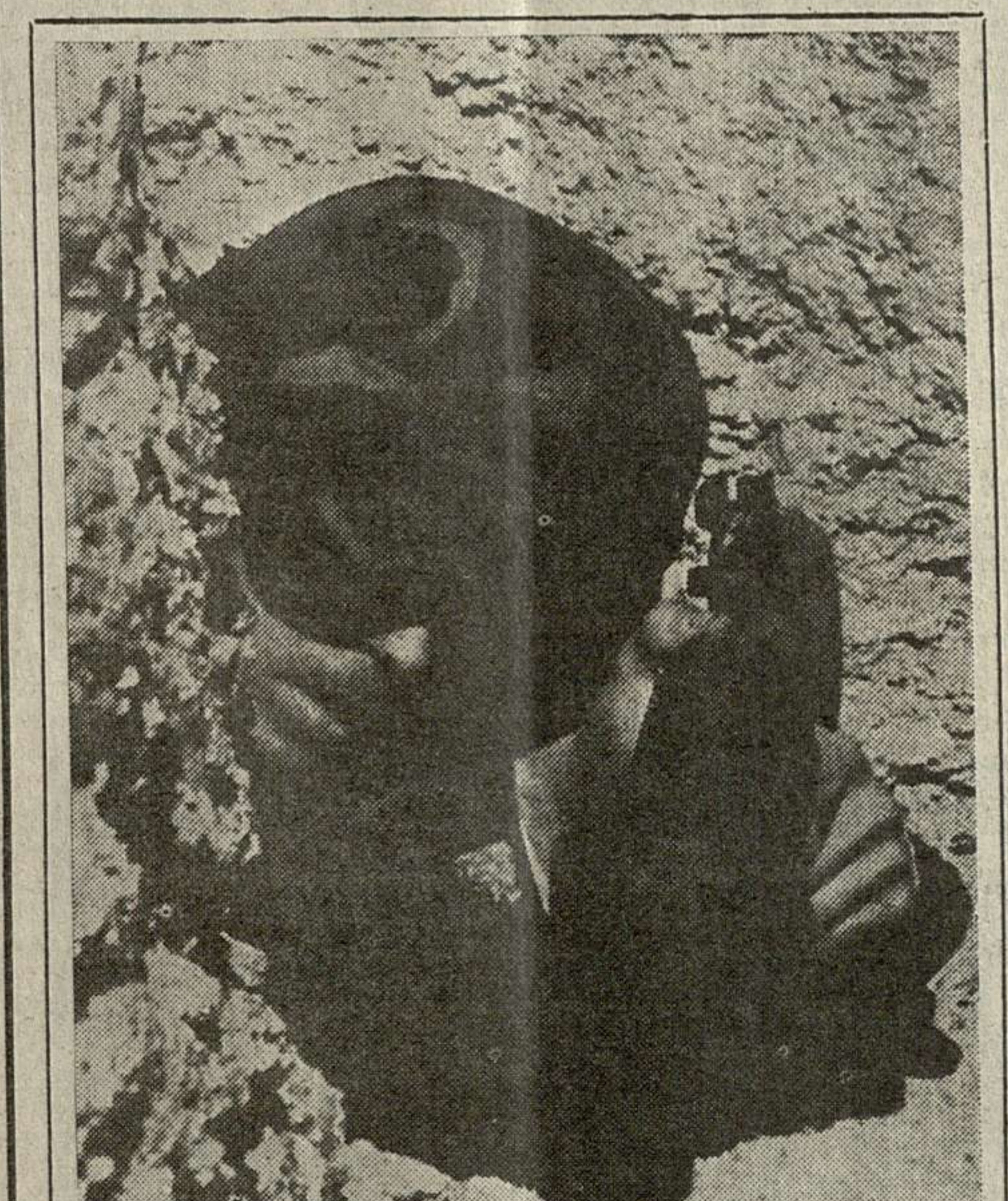
საპარტიო უარს, საპარტიო უარს...