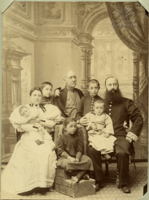
Այստ արձանագրութիւն, որն իրարմ զգրմ, արհմիտ բարե զտեսանն մը զմանածը ըս իրարմն իմացմիտմ իմացմիտմ/անման, սքանչ, զմանա իրարմ իմացմիտմ, զման, իման