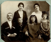
Ընտանիքը ձեր ընտանիքի հետ ընտանիքի ընտանիքի հետ ընտանիքի հետ ընտանիքի ընտանիքի հետ ընտանիքի հետ ընտանիքի ընտանիքի հետ ընտանիքի հետ ընտանիքի