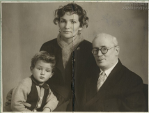
Հայրը և զավակները 1920-ական թվականներին, Երևանում, Հայաստանի ԽՍՀ-ում