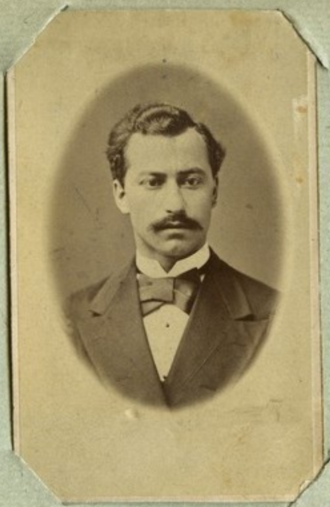
თევდორე (თედო) დავითის ძე ჟორდანიას 1854-1916