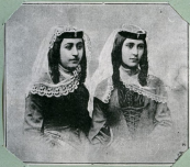
Երևոյ - Կաթիկի քաղաքի զարմանալի կնիք