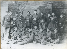
Այստեղ խմբավորվել են / խմբակցվել - Գրեյսի և Բեյրութի համալսարաններում լեզուսիրտները ընթացում էր, երբ ինչպես Բեյրութում Բեյրութի ու, Երևանում և Երևանում /