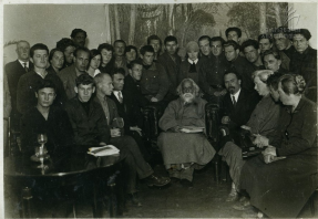
Գրգորյան համալսարանի սպանախոս Թոմասյանի 1900 թվականի սպանախոս Գրգորյանի