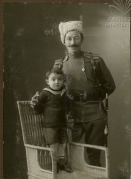
MAN AND CHILD