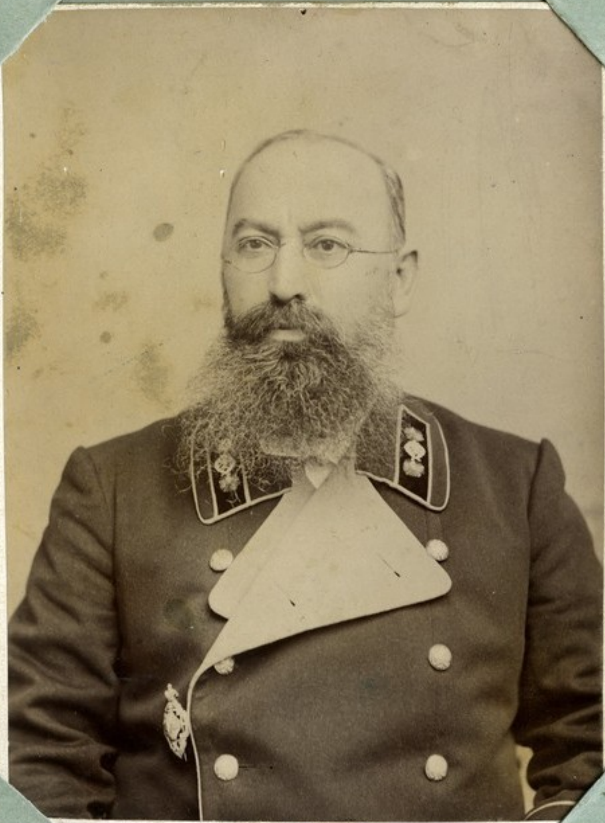
მარტო შარდანი /ნაწილადი სახელმწიფო ბრძეველის ფორმაში/