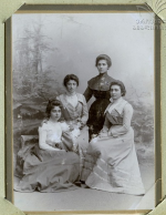
Miss [Name] Miss [Name] Miss [Name] Miss [Name]