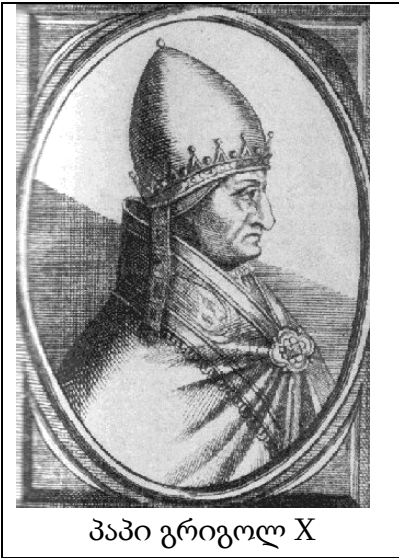
პაპი გრიგოლ X

ისტორიიდან ცნობილია, რომ დიდი სქიზმის შემდეგ საეკლესიო უნიის მრავალ მცდელობას ჰქონდა ადგილი [2]. მაგრამ, მიუხედავად ამისა, მხოლოდ რამდენიმე მათგანის განხორციელება მოხერხდა. დიდი სქიზმის შემდეგ პირველად სწორედ ლიონის 1274 წლის კრებაზე მოხერხდა საეკლესიო უნიის გაფორმება პაპისტებსა და მართლმადიდებლებს შორის.