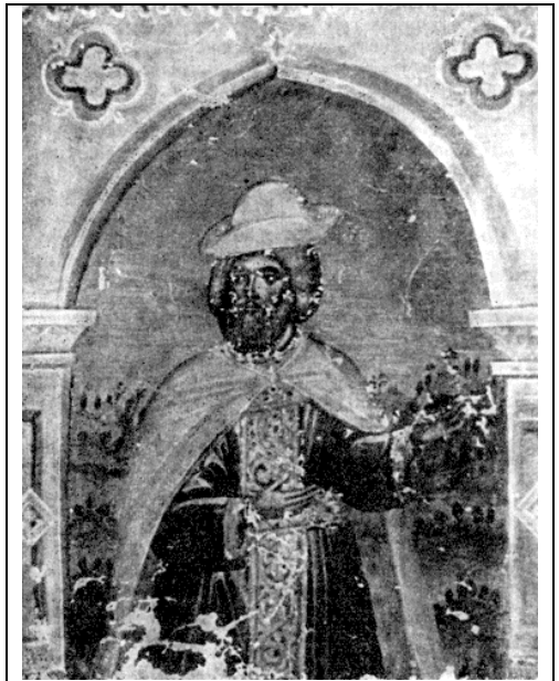
იმპერატორი მიხეილ პალეოლოგი (მინიატურა)

უნია მდიდრი მღვლავრებები გამოიწვია აღმოსავლეთში. მიღწეული შეთანხმება ფაქტობრივად ქაღალდზე დარჩა, რადგან მართლმადიდებელ სასულიეროთა და მრევლის უდიდესმა უმრავლესობამ, თვით მიხეილ პალეოლოგის იმპერიაშიც კი, არ მიიღო იგი. „უმჯობესი იქნება, რომ თუნდაც ჩემი ძმის იმპერია დაიღუპოს, ვიდრე მართლმადიდებელი სარწმუნოება“, - ეს სიტყვები, რომლებიც მიხეილ პალეოლოგის ღვიძლ დას