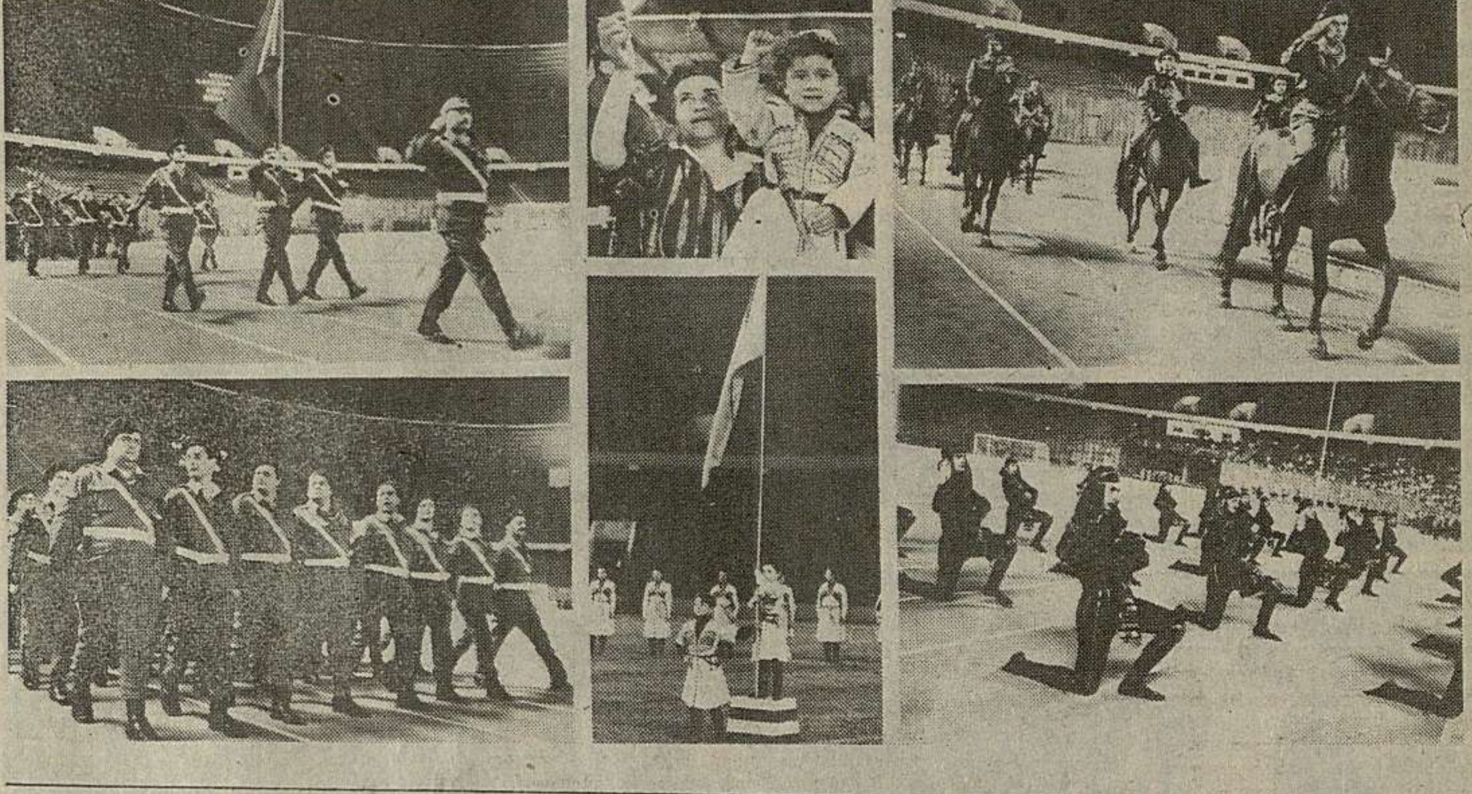
მინდინარე მირაბ კოსტავას დაბადების დღე

სახელმწიფო დამოუკიდებლობის დღის გამო გამართულ შენობაში გვიარსებდა გვიარსებდა. სახელმწიფო დამოუკიდებლობის დღის გამო გამართულ შენობაში გვიარსებდა გვიარსებდა.