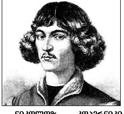
ნიკოლოზ კოპერნიკი (1473 - 1543)

ადამიანი“ სპეციალურად ლეონარდოსთვისაა მოგონილი. მან შექმნა წყლის ბორბლებისა და წყლით მოძრავი მოწყობილობების უამრავი ესკიზი. შეადგინა ტენიანობის საზომი ხელსაწყო სქემა და პრიმიტიული ჩასაყვინთი კოსტუმები სასუნთქი მოწყობილობით. 1482-1499 წლებში ლეონარდომ შექმნა მთელი რიგი სამხედრო დანიშნულების კატაპულტებისა და სხვა სასროლი მანქანების პროექტები. შეადგინა იარაღის ესკიზები, რომლებმაც გაუსწრო დროს. მაგალითად, ისეთი, როგორიცაა ხელფეხმარა, მორტირები (მოკლელულიანი ქვემეხი, ტყვიამურქვევის მსგავსი იარაღი, პრიმიტიული ტანკი და ცეცხლზე გაბედული გამოგონება - წყალქვეშა ნავი. ამ საის შეგვიძლია დავუმატოთ ველოსიპედიც. ლეონარდო ხომ პირველი ადამიანი იყო, რომელმაც ველოსიპედის პირველი ნახაზი შექმნა.