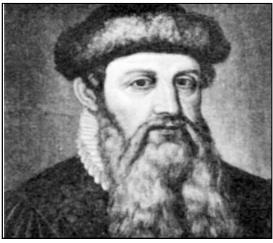
გერმანელი მეცნიერი იოჰან გუტენბერგი (1400-1468)