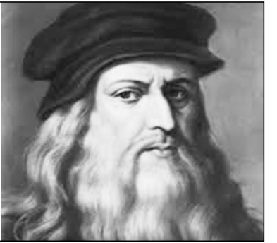
ლეონარდო და ვინჩი (1452-1519)

1450 წელს ააწყო საბეჭდი პრესი მოძრავი შრიფტით. აღმოჩენა, რომელიც მეცნიერების ისტორიაში თავისი გავლენით ციფრული სისტემის შემოღებას უტოლდება. თავისი აღმოჩენით მან გამოიწვია რევოლუციური პროგრესი ევროპაში და აკადემიურ წრეებს საშუალება მისცა ფართოდ და იაფად გაეცნობინათ სამეცნიერო აზრი.