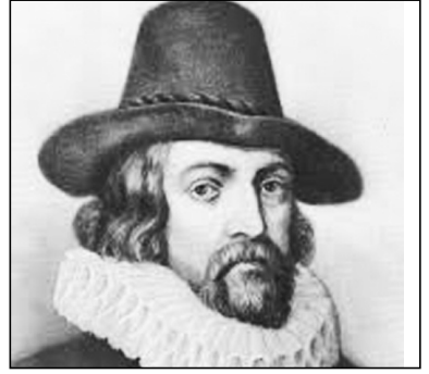
ფრანსის ბეკონი (1561- 1621)

„ადამიანის სხეულის სტრუქტურა.“1543 წელს მიიღეს ჰაბსბურგების სამეფო კარზე, სადაც მსახურობდა იმპერატორის - კარლოს V-ისა და ფილიპე II-ის ექიმად. გარდაიცვალა -50 წლის ასაკში წმინდა მიწის მოსალოცად მგზავრობის დროს. ნადრევი სიკვდილის მოუხდავად ვესალიუსმა სტუდენტებისთვის ანატომიაში რევოლუციური მემკვიდრეობა დატოვა (ადამიანის გაკვეთის პრაქტიკულ მეცადინეობებში).