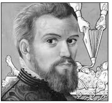
ანდრეას ვესალიუსი (1514 - 1514)

მზე წარმოადგენს ცენტრს და მის გარშემო მოძრაობენ პლანეტები. ბედის ირონიაა, რომ მისი ავტორი კოპერნიკი სასულიერო პირი იყო. თუმცა ამით იგი დაუპირისპირდა პტოლემეუსის მიერ აღიარებულ გეოცენტრულ მოდელს. კოპერნიკმა კარგად გამოიყენა კელესია კელევისათვის. როცა სამრეკლოდან აკვირდებოდა ვარსკვლავებს, მან წამოაყენა იდეა, რომ დედამიწა თავის მხრივ არ იყო ერთ ადგილზე გაჩერებული, არამედ ბრუნავდა თავისი ღერძის გარშემო 24 საათის განმავლობაში. ეს იდეა ასევე ხსნიდა ვარსკვლავებისა და მზის მოძრაობას ცაზე. 1609 წელს იოჰან კეპლერმა წარმოადგინა დასკვნა, რომლის მიხედვით პლანეტები მოძრაობენ არა წრიულად, არამედ ელიფსურად და სიმარტივე, რასაც კოპერნიკი ეძებდა, მიღწეულ იქნა. მისი მოდელი კი ნაწილობრივ შენარჩუნდა.