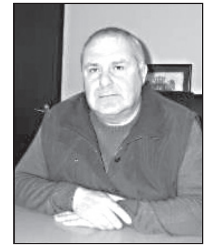
ოდში არ გამოირჩეოდნენ კანონდარღვევებითა და კარგი სპეციალისტები არიან, აუცილებლად ვეცდები, რომ საკრებულოში დავასაქმო.

— საკრებულო წარმომადგენლობითი ორგანოა. აღმასრულებელ უმაღლეს ხელისუფალს მუნიციპალიტეტში გამგებელი წარმომადგენს. გამგებულს კი თავისი რესურსი სჭირდება ტერიტორიულ ორგანოებში, ამიტომ გამგებელმა შეცვალა რწმუნებულები, რომლებიც თავის მხრივ თავის გუნდს წარადგინა საშუაოდ. გამგებელთან, როგორც ვიცო, საკრებულოს ზოგიერთი წევრი მივიდა უკმაყოფილო, რომ მათთვის არასასურველი კანდიდატურა დაინშნარწმუნებულად. ჩემი მხრივ, ის კადრები, რომლებიც წინასაარჩევნო პერიოდში არ გამოირჩეოდნენ კანონდარღვევებითა და კარგი სპეციალისტები არიან, აუცილებლად ვეცდები, რომ საკრებულოში დავასაქმო.