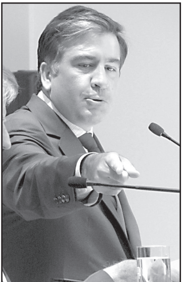
ბიძინა ივანიშვილიმ განაცხადა, რომ „ქართული ოცნება“ არ აპირებს პრეზიდენტის იმპიჩმენტს. ამის მიზეზი რამდენიმეა: „ქართული ოცნებას“ არ აქვს პარლამენტში იმპიჩმენტისათვის საჭირო რაოდენობის ხმები; პრეზიდენტი, როგორც პოლიტიკური ძალა, საშიში აღარ არის; იანვარში საპრეზიდენტო არჩევნების ჩატარება დამატებითი პრობლემები საქართველოსთვის

კონსტიტუციის მიხედვით მორიგი საპრეზიდენტო არჩევნები 2013 წლის 10 ოქტომბერს უნდა გაიმართოს. მოქმედა პრეზიდენტმა კონსტიტუციური ცვლილების მიხედვით დაახლოებით 9 თვით გაიხანგრძლივა სახელისუფლებო ვადა და თუ კიდევ ერთხელ არ შეიტანეს აღნიშნულ საკითხზე ცვლილება კონსტიტუციაში, მაშინ მიმდინარე წლის შემოდგომაზე კიდევ ერთ პოლიტიკურად დატვირთულ პერიოდს უნდა ველოდეთ.