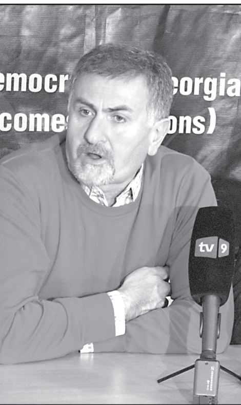
სიბინძურეში არ ჩართულიყო, რასაც მათ ავალენდნენ. ვიმეორებ, შეიძლება გამოწვევები იყვნენ, მაგრამ უცებ რომ ყველა ანგელოზი გახდა, მე ამის არ მჯერა. ეს ამ ხელისუფლებას, ადრე თუ გვიან, წინ დახვდება.

– რა თქმა უნდა, ასუსტებს. სხვათა შორის, ნელან ვსაუბრობდით ძველი ადვოკატები, ვისაც კარგად ახსოვს გამსაღებლის პერიოდი. გამსაღებელი დაღუპა სწორედ იმან, რომ გამოაცხადა – კომუნისტების პერიოდში მომუშავე პროკურორები თუ მილიციელები ახლა არიან ეროვნული ხელისუფლების პროკურორები და მილიციელები, ანუ გაკეთილშობილდნენ. ზუსტად ამას აცხადებს „ქართული ოცნება“. ის ადამიანები, ვინც ემსახურებოდნენ ძველ რეჟიმს სასტიკი მეთოდებით და ხშირად შემოქმედნი იყვნენ ამ რეჟიმის, დღეს თურმე გაკეთილშობილდნენ. მე ამის არ მჯერა. მე არ ვამბობ, რომ გამორჩეულნი არ შეიძლება იყოს, მაგრამ მასობრივად არ შეიძლება იყოს ადამიანების დატოვება თავიანთ თანამდებობებზე, ეს სწორედ არ მამაინა. ვფიქრობ, ეს პრობლემა საკმაოდ მწვავედ დაუდგება ადრე თუ გვიან ამ ხელისუფლებას, ვინაიდან მათი უმრავლესობა ვინცდარჩა, არიან სწორედ სააკაშვილის რეჟიმის შემოქმედნი. იმიტომ, რომ ადგილობრივი პროკურატურის და ვანო მერაბიშვილის პოლიციის პირობებში, რაც არ უნდა შინაგანად პატიოსანი ყოფილიყო ადამიანი, გაუჭირდებოდა შინაგანი ნესიერების შენარჩუნება, რომ იმ