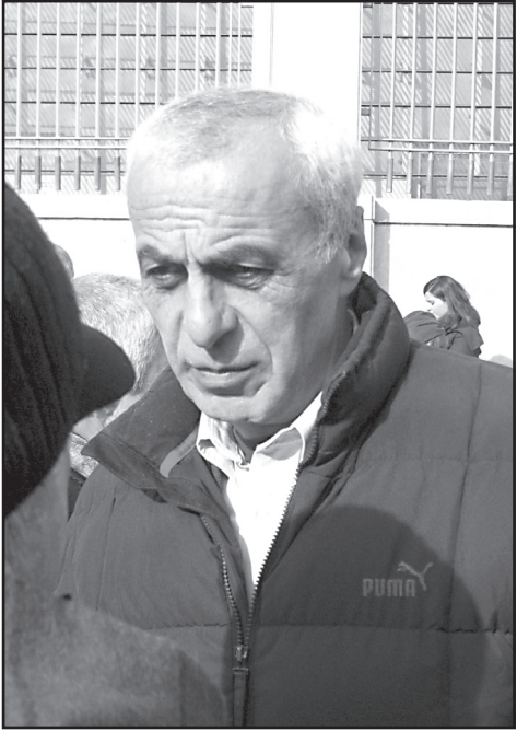
რატიმ ასე მკაცრად?

თურქეთის გაერთიანებული შტაბების ყოფილი უფროსი დააკავებს, არადა, თურქეთი ნატოს წევრი ქვეყანაა. დამნაშავე უნდა დაისაჯოს! არაკეთილშობილი მითქვამს!