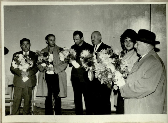
სტუმრებს აჩილოებენ თაიფულებით