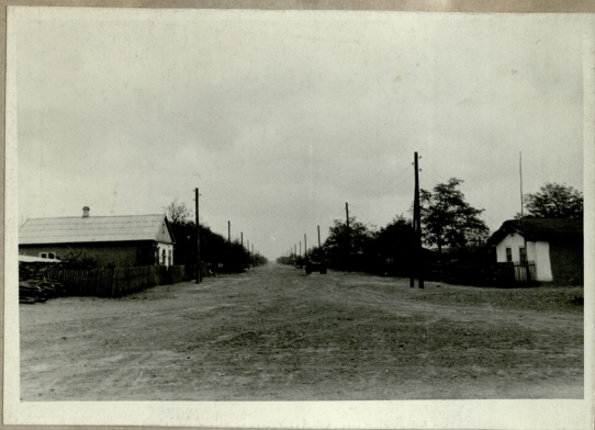
სოფ. ნოვო-ივანოვკა /ქართული სოფელი/