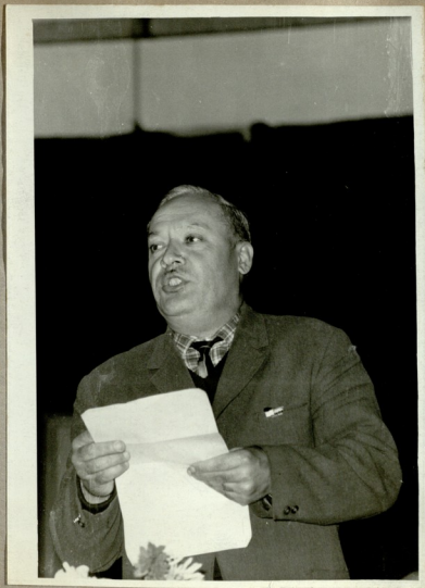
პოეტი ვ. გოდგანელი