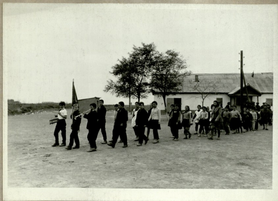
იუნიონული ზონები გახლდებიან მსახურად