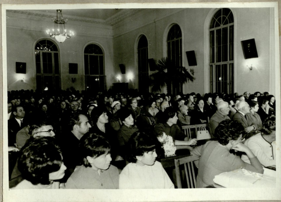
დასტავი სახეიმი სადამი