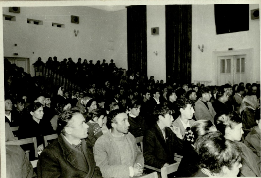
ღარბაზი საზოგადოებრივ სალაშქრო