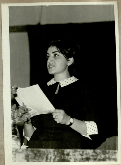
„ჯიქხის ცეასნის“ გამოსქმების შესახებ ბიბლიოგრაფიულ მიძობილქას აქთოქს, ი. გურგენიძე