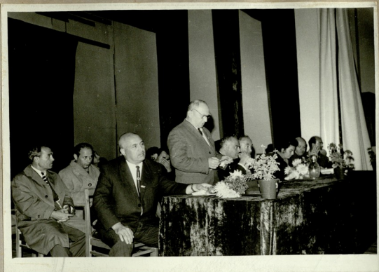
მისასალმებელი სიგუჯით გამოდის ს. გაღლია