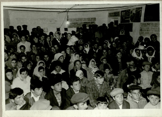
დარბაზი საზოგადოებრივ სალაშქროზე