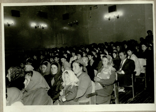
ღარბაზი საზეიმო სალამოზე