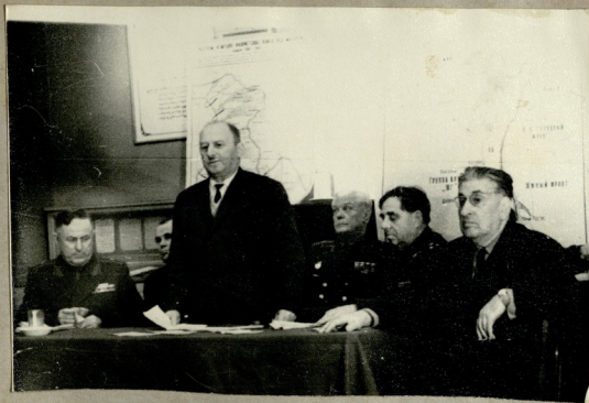
სალამის შესაქალი სიფყვით ხსნის ს.გაღლოი