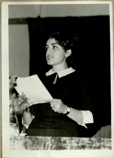
„ქეთხისცუაოსნის“ გამოცემის შესახებ ბიბლიო- გრაფიულ მიმოხილვას აკეთებს იტურგენიძე