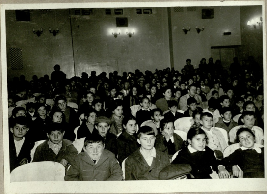
ღარბაჯი სახეიმი სალამოზე