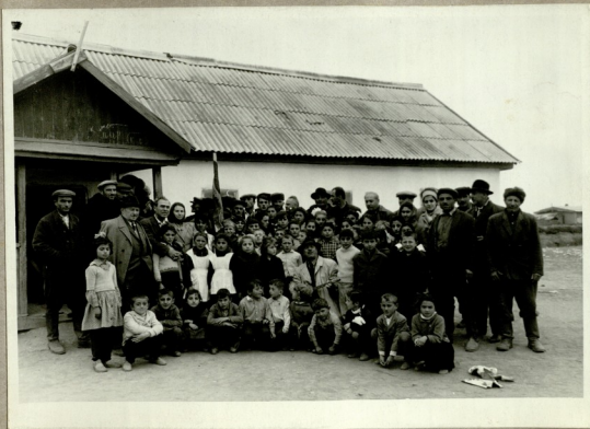
სერატი ვადაცხელი ივანოვილი ქართველებთან