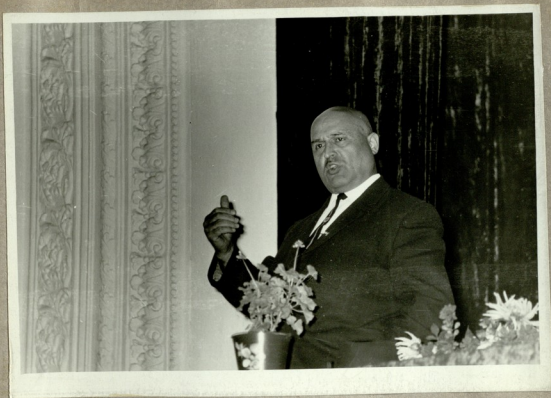
მოსვენებას თემაზე: შოთა რუსთაველი და მისი „ვეფხისტყაოსანი“ აქეთებს დოქ. პ. ლუღუშაური