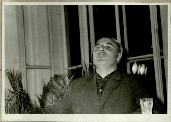
მისანაღმებლ სიგეით გამოდს ნ.ჯანსუკიანს სხ. რეს. ბიბლიოთეკის მკითხველი