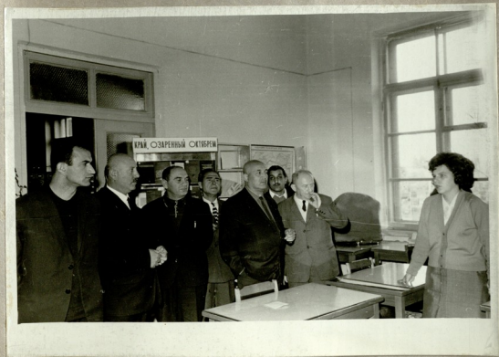
Նիցյան շքերթի անդամները ԼՄԻ ՕՍՏՐԵՐԻՆԱ ՕՍՏՐԵՐԻՆ տանը ընդունելու ժամանակ Գ.Նաչոյա