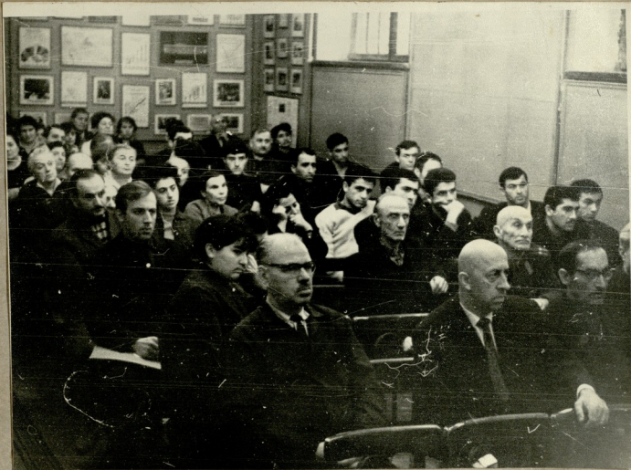
დასწავლა თემატურს სალაშქარში