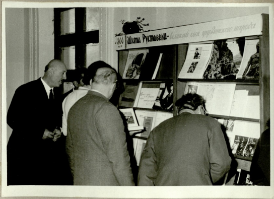
ქართული სტუმრები შოთა რუსთაველის დაბადების 800 წლისთავადმი მიძღვნილ გამოფენასთან