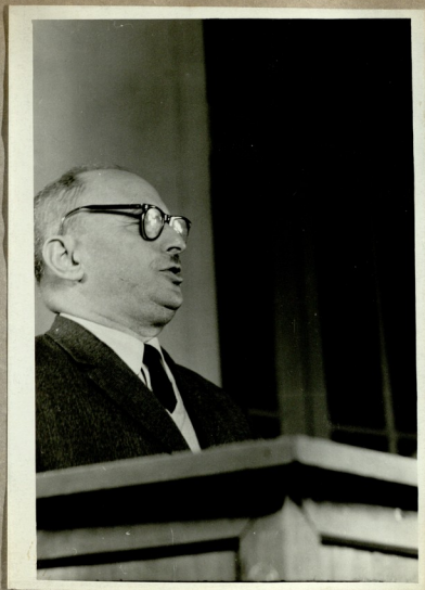
მისხალამებელი სიგევით გამოსის ს.გაღლია