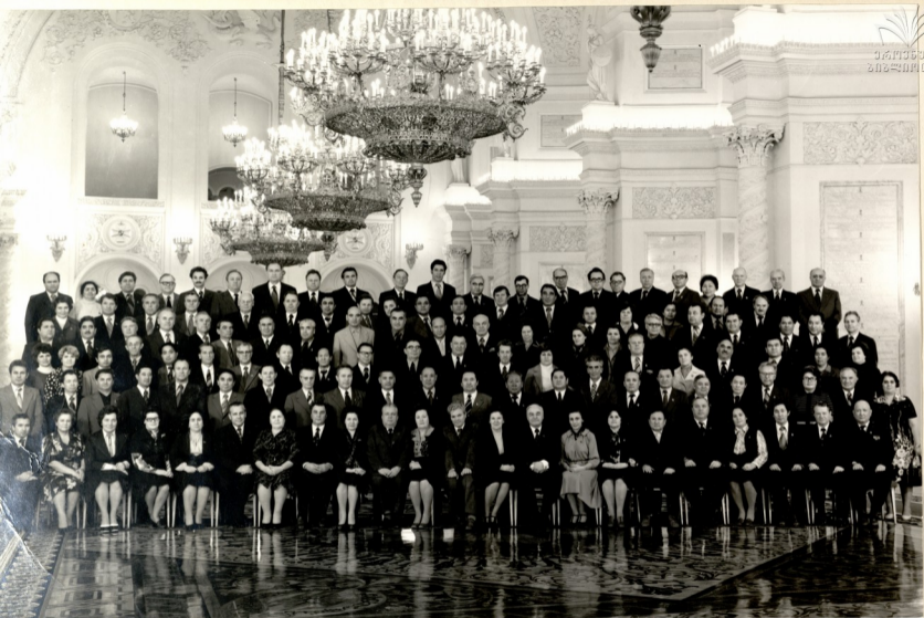
СОВЕТСКИЕ РАБОТНИКИ—СЛУШАТЕЛИ ИНСТИТУТА ПОВЫШЕНИЯ КВАЛИФИКАЦИИ АКАДЕМИИ ОБЩЕСТВЕННЫХ НАУК ПРИ ЦК КПСС