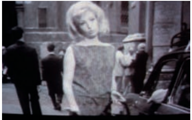
მკვდარი ჩეჩენის უკანალში-თქო. ასე უფრო ეფექტური იქნებოდა!”

დამეთანხმებით, ადამიანისათვის შენიშვნის მიცემა არც თუ ისე ადვილია. ამ დროს მაქსიმალურად უნდა დაინდო მისი თავმოყვარეობა და რაც შეიძლება, რბილად მიანიშნო შეცდომაზე. ჩემი დაკვირვებით, სხვადასხვა ქვეყანაში განსხვავებული ტემპერამენტით იძლევიან შენიშვნებს და შესაბამისად, განსხვავებულად რეაგირებენ მათზე. ამ მხრივ, ყველაზე დახვეწილები მაინც ბრიტანელები არიან. საკუთარ ტყავზე მაქვს გამოცდილი სარკაზმის და იუმორის ლონდონური ნაზავი. ამერიკელები ბრიტანულ დახვეწილობას მოკლებულნი არიან, თუმცა მათაც ურიგოდ არ გამოსდით. ფრანგები უხეშობის ზღვარზე იძლევიან შენიშვნებს, გერმანელებიც; რუსები კი შენიშვნებს არ იძლევიან, ისინი, უბრალოდ, „ხამიატ“. ერთხელ ჩემი ერთი მოსკოველი ნაცნობი ორი დღის მანძილზე იტანჯებოდა იმის გამო, რომ საკადრისი პასუხი ვერ გასცა შენიშვნაზე, რომელსაც, სხვათა შორის, იმსახურებდა და წამდაუნუნ მეუბნებოდა: „გაიგე, კაბა, კი არ უნდა მეთქვა ჩემ უკანალში ჩაყავი ცხვირი მეთქი, არამედ