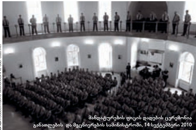
მანდატურების ფიცის დადების ცერემონია განათლების და მეცნიერების სამინისტროში, 14 სექტემბერი 2010