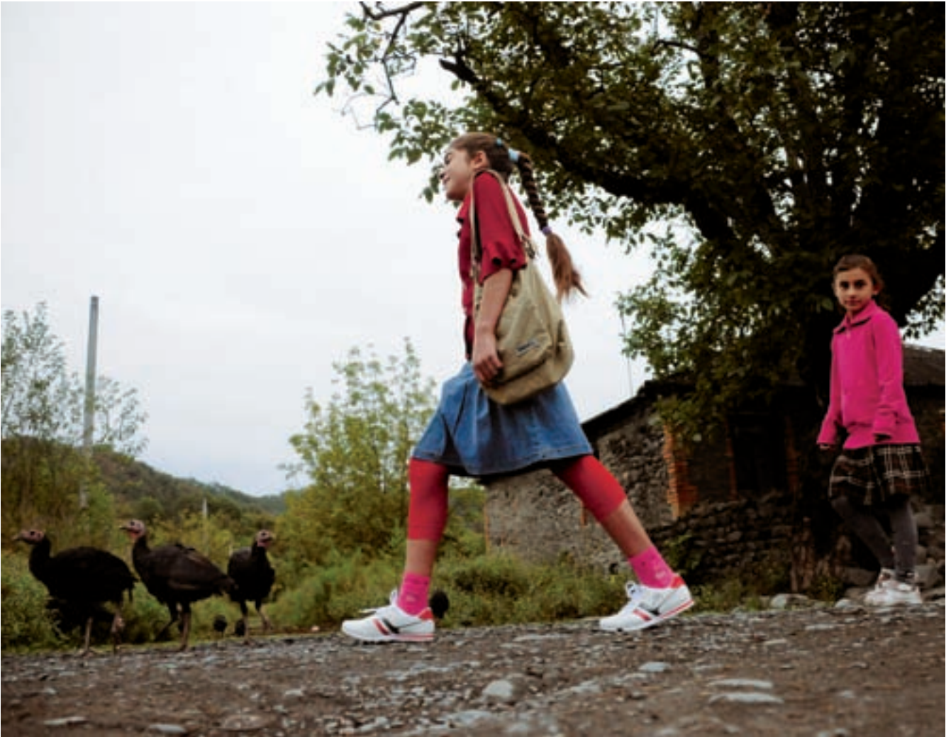
ფოტო მარია შორიანი