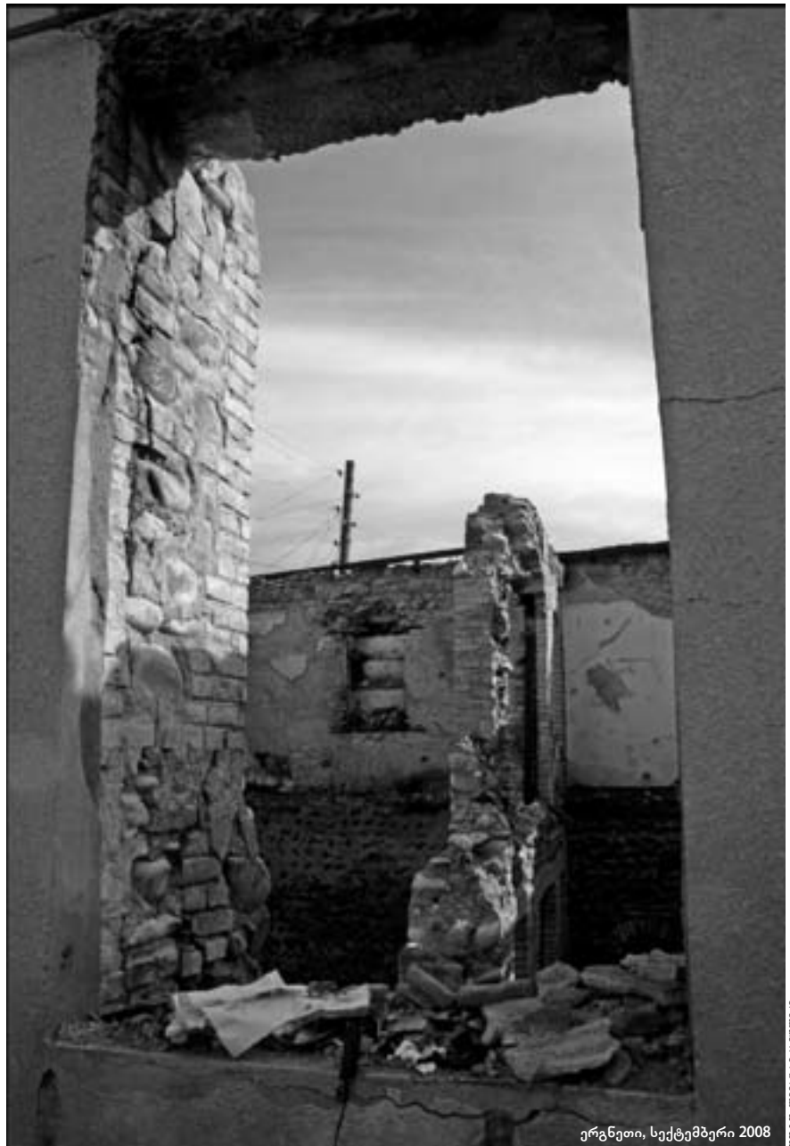
ერგნეთი, სექტემბერი 2008

„საქართველოს მოსახლეობის თითქმის 10 პროცენტი ამჟამად საკუ-