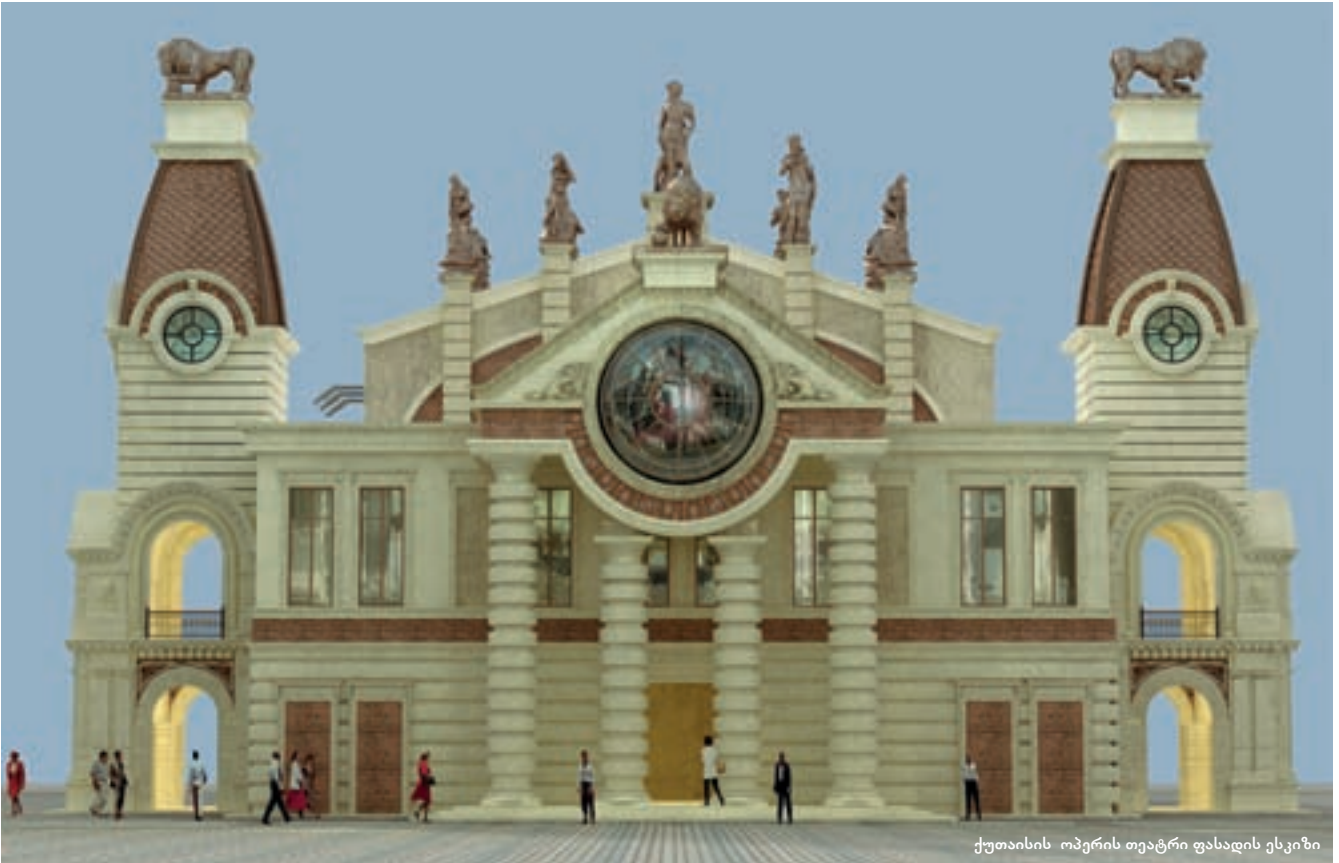
ქუთაისის ოპერის თეატრი ფასადის ესკიზი