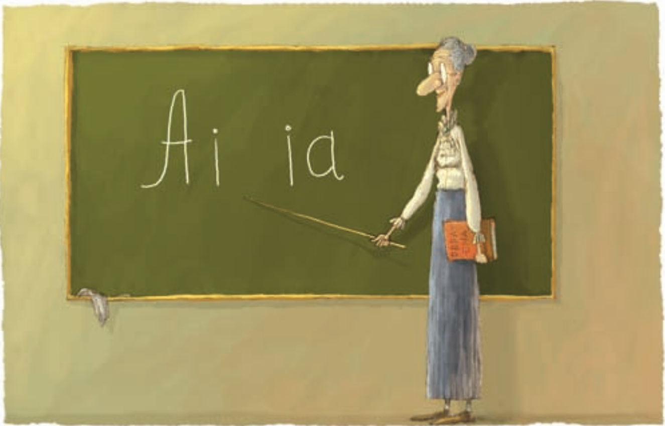
ილუსტრაცია: ვალერი პავლი

„საქართველოში რომ უცხოელი ჩამოვიდეს, ხომ უნდა გავაგებინო!“ – ამბობენ პატარა ოთო და მისი თანაკლასელები, რომლებსაც უხარიათ, რომ ინგლისურის სწავლას იწყებენ. მათნაირად ფიქრობს საქართველოს პრეზიდენტიც – „გაქცეულის მობრუნება მაინც ხომ უნდა შეგეძლოთ“, - ამბობს და მიაჩნია, რომ ინგლისურის სწავლის დაწყება ყველა ასაკში თანაბრად საჭირო და დროულია. ■