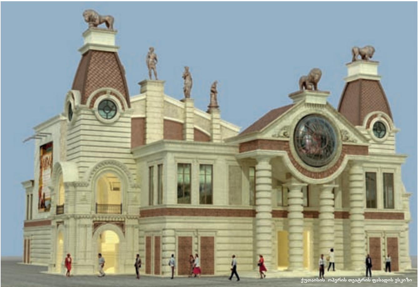
ქუთაისის ოპერის თეატრის ფასადის ესკიზი