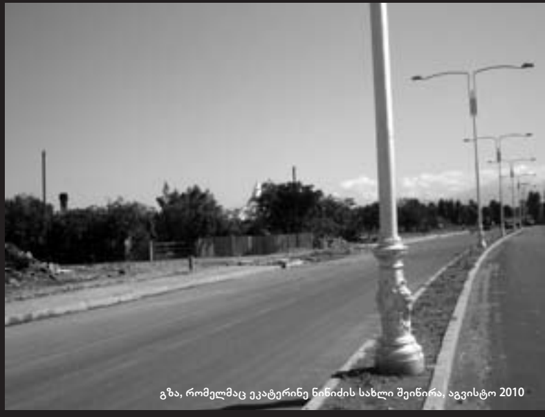
გზა, რომელმაც ეკატერინე ნინიძის სახლი შეინორა, აგვისტო 2010