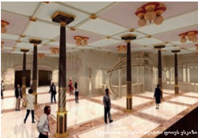
სქუთაისის ოპერის თეატრი ფოიეს ესკიზი

რემონტი დაჩქარებული ტემპით მიდის – მელიტონ ბლანჩივადის სახელობის ოპერისა და ბალეტის თეატრში დაარსებიდან 41-ე, და „ვარდების რევოლუციის“ მეშვიდე წლისთავის აღსანიშნად ემზადებიან. კომპანია „დაგს“ ობიექტის ჩასაბარებლად ვადა 22 ნოემბრამდე აქვს მიცემული, თეატრის ახალი შენობის საზეიმო გახსნა კი მეორე დღეს, 23 ნოემბრისთვისაა დაგეგმილი.