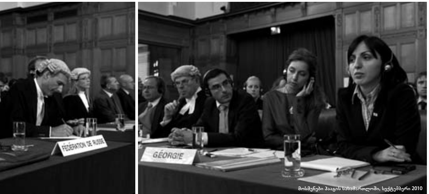
მოსმენები ჰააგის სასამართლოში, სექტემბერი 2010

■ ამ მოსმენების შემდეგ უნდა გადაწყდეს, საერთოდ მიიღებს საერთაშორისო სასამართლო საქართველოს სარჩელს დეტალურ განხილვაში, თუ რუსული მხარის არგუმენტს გაიზიარებს, რომ ეს საქმე სასამართლოს კომპეტენციაში არ შედის.