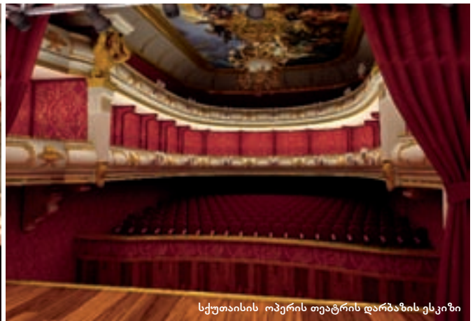
სქუთაისის ოპერის თეატრის დარბაზის ესკიზი

ამ თანხით შპს „დაგს“ შენობის ფასადი და ფოიე უნდა აღედგინა. თეატრის სრულად გარემონტებას ადგილობრივი ხელი-სუფულება მაშინ არ აპირებდა.