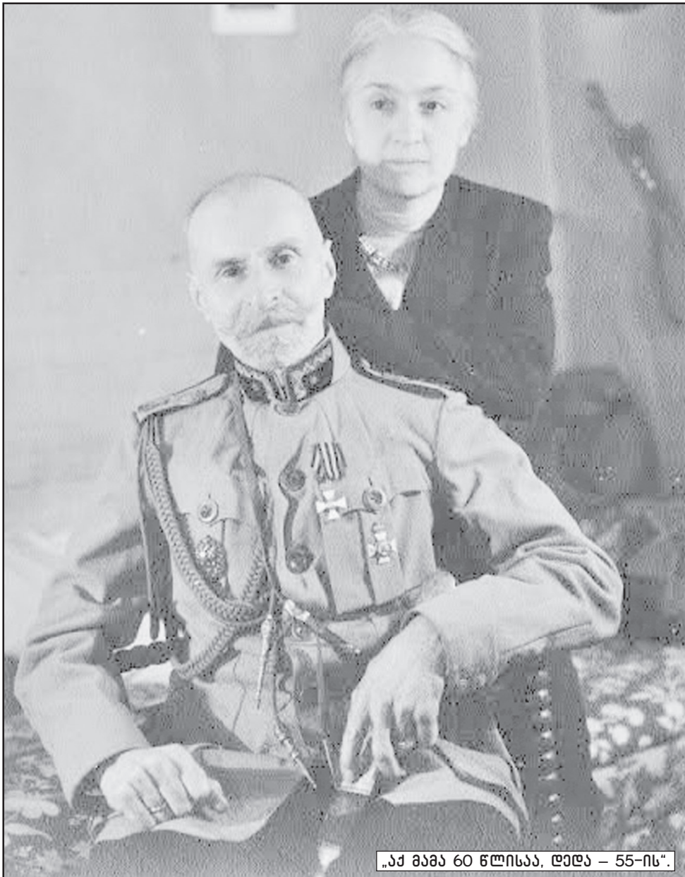
„ამ მამა 60 წლისაა, ღელა – 55-ის“.

ლავილი, შატუ, გენერალ კვინიტაძის ქალიშვილთან