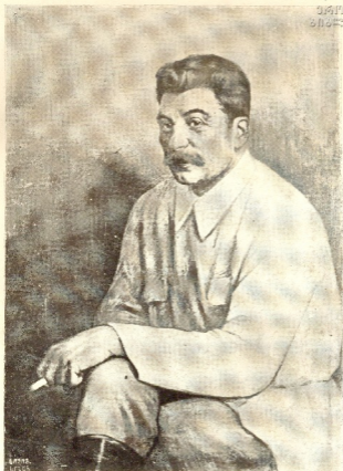
რ. კ. ბ. ც. გენერალური მდივანი. ი. ბ. სტალინი—ჯუღაშვილი.