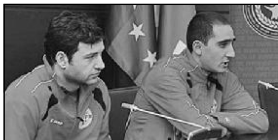
ნალური ეტაპი 12 საუკეთესო გუნდის მონაწილეობით 2014 წელს ბელგიაში გაიმართება.

ჯგუფის პირველადილოსანი აპრილის თვეში ჰოლანდიაში გასამართ ელიტ-რაუნდში ითამაშებს, სადაც B ჯგუფის გამარჯვებულთან ერთად ჩეხეთი, ბელარუსი და მასპინძელი ჰოლანდიის ნაკრებები არიან განთესილნი. ევროპის ჩემპიონატის ფინალური ეტაპი 12 საუკეთესო გუნდის მონაწილეობით 2014 წელს ბელგიაში გაიმართება.