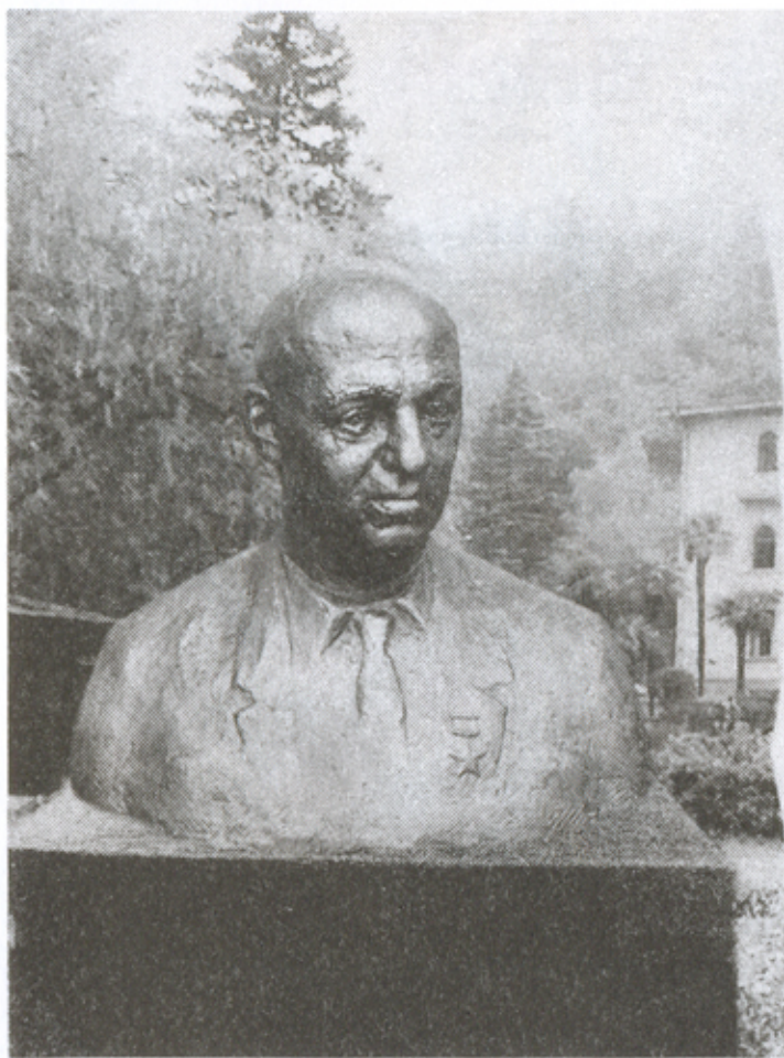
11. კარლო ლომადის ბიუსტი.

საქართველოს სახელმწიფო უნივერსიტეტი ფილოსოფიის ფაკულტეტი საქართველოს სახელმწიფო უნივერსიტეტი