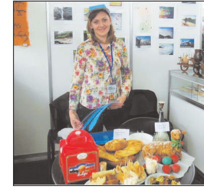
გამოფენაში მონაწილეობდნენ საქართველო, სომხეთი, არაბეთის გაერთიანებული საემიროები, ტაილანდი, შვეიცარია, რუსეთი, ლიტვა და პოლონეთი.

50 საგამოფენო სტენდზე, 150-მდე ადგილობრივი და უცხოური ორგანიზაციები და ტუროპერატორები იყვნენ წარმოდგენილი. მათ შორის იყო გურიის საგამოფენო სტენდიც, რომელიც ოზურგეთისა და ჩოხატაურის მუნიციპალიტეტებმა ერთობლივად მოამზადეს.