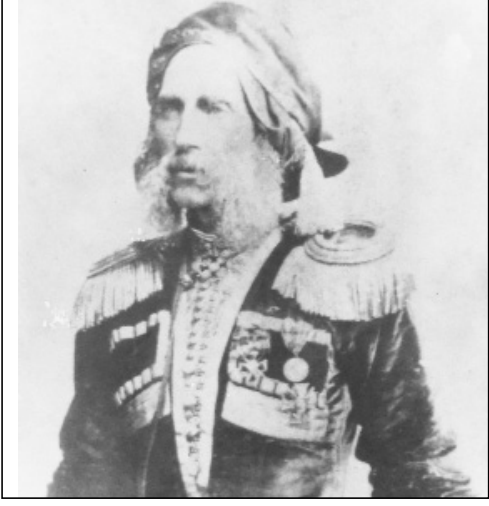
ქართული გენერალიტეტის 300-წლოვანი ისტორიაში ბრწყინავდნენ გენერალი გურიელების სახელები.

გენერალ-მაიორი ივანე გურიელი მათ შორის ერთ-ერთი გამორჩეული გახლდათ. იგი გურიის მთავრის ქაიხოსრო მე-3-ის შვილიშვილი იყო. მონაწილეობდა რუსეთ-თურქეთის 1789-1791 წლების ომში. ამ ბრძოლებში მამაცობისათვის პორუჩიკის წოდება მიიღო. 1792-1794 წლებში, სუვოროვის ხელმძღვანელობით, იბრძოდა ვეროპოლში. გამორჩეული მამაცობისათვის პრემიერ-მაიორობა მიიღო, 1799 წელს - პოლკოვნიკობა. 1803 წელს 31 წლის ასაკში გენერალ-მაიორის წოდება მიენიჭა და ვოლინის პოლკის უფროსად დაინიშნა. ნაპოლეონის რუსეთზე თავდასხმის შემდეგ მონაწილეობდა ყველა მთავარ ბრძოლაში. პეტრე ბაგრატიონის წარდგინებით, წმინდა ვლადიმირის III ხარისხის ორდენით დაავიჯდნენ. დაავიჯდნენ იყო წმინდა ანას I ხარისხის ორდენით. ვიანაში ბრძოლაში მამაცობისათვის ალექსანდრე I-მა ალმასებით შემკული ოქროს დაწნა უბოძა წარწერით: „მამაცობისათვის“. 1813 წელს, 8 მაისს ბუნკვითან ბრძოლაში გმირობისათვის წმინდა ანას პირველი ხარისხის ალმასის ნიშნებიანი ორდენი გადაეცა.