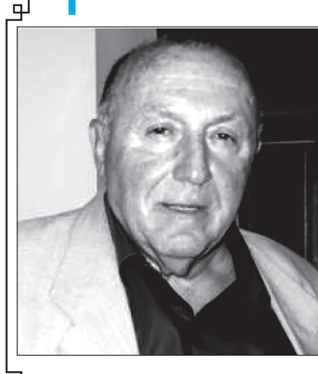
ბილოცავი დაბადების დღეს – 1 იანვარს ვულოცავთ XX-XXI საუკუნეების უდიდეს ნოველისტს, საზოგადო მოღვაწეს და უკეთესობილეს პიროვნებას, საქართველოს მწვერულთა კავშირის თავმჯდომარეს რევან მისველაძეს. ვუსურვებთ ხანგრძლივ სიცოცხლეს, კვლავ მრავალი ნოველებით გაემდიდრებინოს ქართული მწერლობა. ჩვენი ბედია ზამთრისა და ღმერთმა გაგვადლებინოს!... – ეს ბატონი რევან მისველაძის სიტყვებია. გაზეთი „კავკასიის“ შურნალისტები და მწერლები

ვერაინ იტყვის იმას, რაც არ თქმულა მზის ქვეშეთში. თქვენი აქ ყოფნის სიხარულს ვულოცავ ქართველ ხალხს – უფლის ამ უჩვეულო ჯილდოს. ამ ხილნური მტრების ექსპანსიის (შემოტევის) და სულიერი (და ფიზიკური) მერყეობის ჟამს „სიმურთა“ დენასა და ხორშაქთა ფრფენვაში... თქვენ – 36 წელი