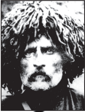
„ღმერთო, სამშობლო მიცოცხლე, მძინარეც ამას ვღუდუნებ!“