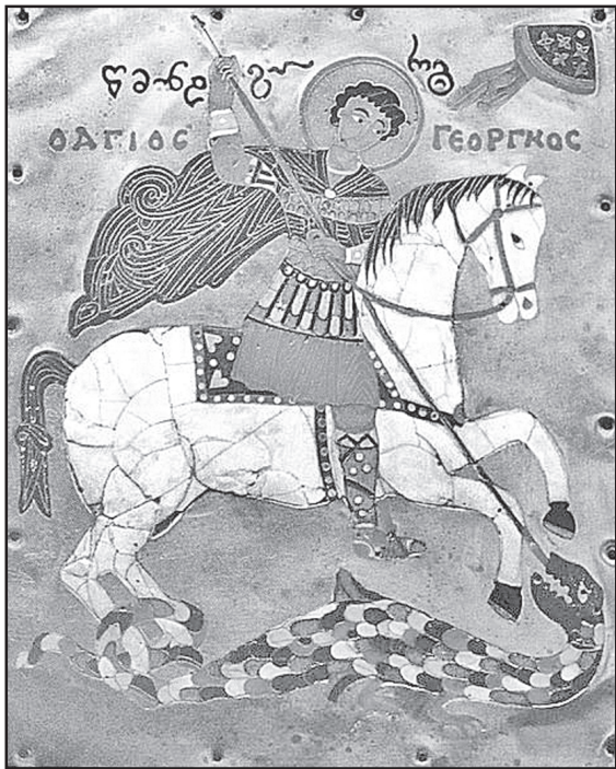
ღღეს, 6 მაისს საქართველოს სამოციქულო მართლმადიდებელი ეკლესია ღღესასწაულობს წმიდისა დიდებულისა, დიდმონაზონისა, ძღვევამოსილისა და სასწაულმოქმედისა გიორგის სსენებას.

წმინდანები, განმანათლებლები, მაგრამ განსაკუთრებული მფარველია წმინდა გიორგი. მის შესახებ უამრავი ლეგენდა და თქმულებაა. საქართველოს რომელ კუთხეში არ არსებობს მის სახელზე აგებული ეკლესია-მონასტრები. ისიც ცნობილია, რომ მართლმადიდებელ სამყაროში და განსაკუთრებით ჩვენში სახელებს შორის უდიდესი პოპულარობით სარგებლობს გიორგი.