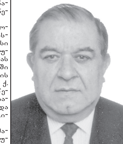
ვახტანგ რაზმაძე 12 მაისს 85 წელი შეუსრულდებოდა

ციხიდან გაანთავისუფლა 1989 წლის 9 აპრილის მოვლენების დროს პატიმრობაში მყოფი მერაბ კოსტავა, გია ჭანტურია, ზვიად გამსახურდია და ირაკლი წერეთელი. შეწყდა მათი სამართლებრივი დევნა. 1990 წელს ვახტანგ რაზმაძე დაინიშნა დამოუკიდებელი საქართველოს პირველ გენერალურ პროკურორად, ხოლო ორი წლის შემდეგ იგი სახელმწიფო მეთაურის ე. შევარდნაძის მთავარ სახელმწიფო მრჩეველად გადაიყვანეს. ერთი წლის შემდეგ კი დამსახურებულ პენსიაზე გავიდა. 1999 წელს ვ. რაზმაძე საქართველოს პარლამენტის წევრი გახდა. მთავარ პროკურორად მუშაობის პერიოდში ვ. რაზმაძემ დიდი მონაწილეობა გამოიჩინა და პროკურატურის ორგანოებში სამუშაოდ მოიზიდა ახალგაზრდა, საქმიანი და პატიოსანი იურისტები. სამუშაოზე აწინაურებდა მხოლოდ იმას, ვისაც საქმიანობაში წარმატებები ჰქონდა და საზოგადოებაში კარგი ავტორიტეტით სარგებლობდა. ამ კრიტერიუმით მან მიაღწია პროკურატურის ორგანოებში კვალიფიციური კადრების მოზიდვას და ყველას შეუქმნა მუშაობისა და ყოფაცხოვრების ნორმალური პირობები.