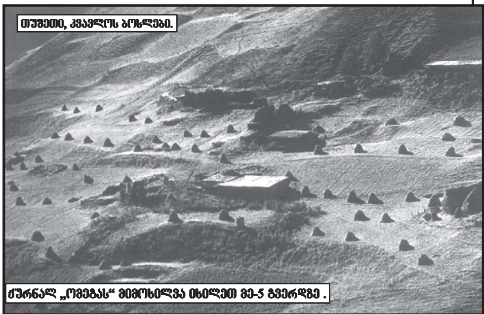
თუშეთი, კავკასიის ბოსფორი.