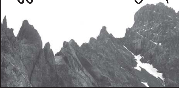
გვიწვივს ქრისტეშობის იმეო ჭაბუჩაძის მითე მომხარებელი ჭიკლოში