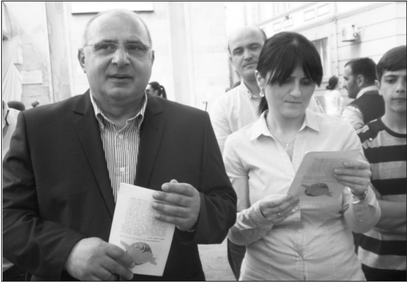
— საქართველოში რატომღაც ასეა მიღებული: ახალ თანამდებობაზე ახალ თანამდებობის პირს თავისი გუნდი მოჰყავს. ხომ არ აპირებთ ძირეულ საკადრო ცვლილებებს სამხარეო ადმინისტრაციაში?

— როდესაც დაინიშნე გუბერნატორად, როგორც გუბერნიაში, ისე მუნიციპალიტეტებში უკვე ჩატარებული იყო ტესტირებები და გასაუბრებები. ეს ადამიანები დანიშნულები არიან შესაბამის თანამდებობებზე. თუმცა, მინდა გითხრათ, რომ არ გამოვიცხავ საკადრო საკითხებს გუბერნიის ადმინისტრაციაში. ალბათ, მოგვიწევს გამოშვებობა იმ სახელმწიფო მოხელეებთან, რომლებიც ვერ ასრულებენ თავიანთ უფლებამოსილებებს, მიუხედავად იმისა, რომ დანიშნული არიან ატესტაციის შედეგად, მაგრამ ვერ ქმნიან ხელფასის ეკვივალენტურ პროდუქტს. ვეცნობი მათ მიერ ჩატარებულ სამუშაოებს, საქმიანობას, გადაწყვეტილებები, ალბათ, მოგვიანებით იქნება მიღებული.