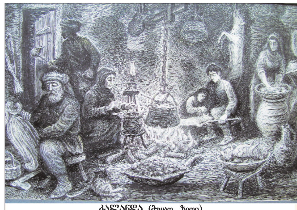
კალანდა (მუყაო, ზეთი)