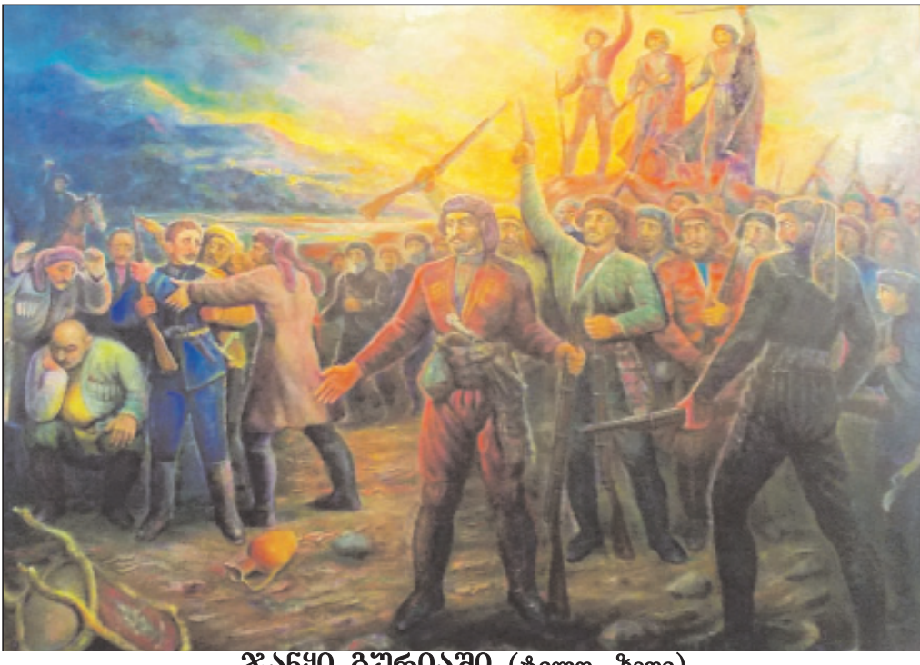
ჯანყი პურიში (ტილო, ზეთი)

გადაინაცვლა. ჩვენი საზოგადოება კარგად იცნობს მხატვარ მძებს, ვა და თამაზ დარჩიებს, მათ შემოქმედებას. დარჩიათა ოჯახის მომდევნო თაობებშიც უკვე ფესვიანობს ნიჭი ხელოვნებისა. კატალოგი, რომელსაც 61 ნამუშევარი ამშვენებს, მხატვრის ლექსით სრულდება, ეს მისი ნახატებია, სიტყვათა კონაში მოქცეული, სადაც ასევე გურული ყოფა ჩანატული.