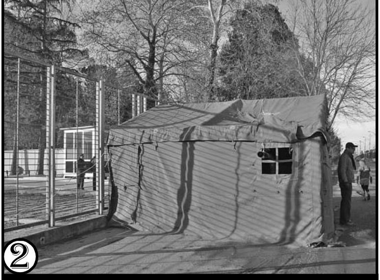
ვნეპათალავა უზადიღუი. პრაზიდენტის რაზიდენტისი წინ გაულილი კარვის გამო