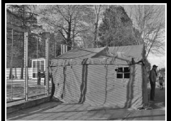
ვინააბაღა ზუგდიდში. პრაზიდენცია რეზიდენციის წინ გაშლილი კარვის გაყო