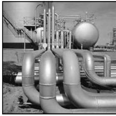
თობროდუქტები წელიწადში 1-1,2 მლნ ტონაა, რაც საჭიროებს 2 მლნ-მდე ტონის გადამამუშავებას.

სპეციალისტები იმედს გამოთქვამენ, რომ ახალი მთავრობა ამ საკითხების გააქტიურებაზე იზრუნებს. ორი მცირე ზომის ქარხანა საწვავის იმპორტს 85 პროცენტით შეამცირებს. საქართველოში მინიმალურად მოსახმარებელი აუცილებელი ნავ-